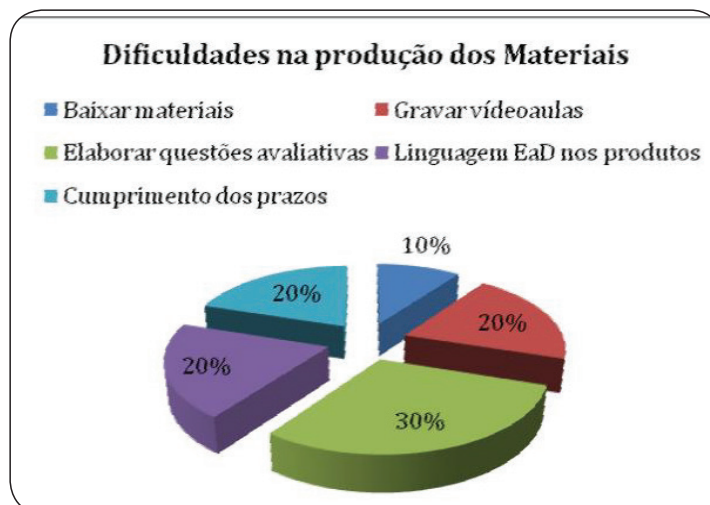
Gráfico 2- Dificuldades na produção dos materiais

Sobre as dificuldades apontadas na elaboração dos materiais, foram identificados os principais aspectos, exibidos no gráfico a seguir: